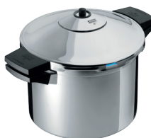
DUROMATIC® INOX SEITENGRIFFMODELL

Ø 20 cm / 3.5 L UVP € 219.00 € 169.00 30373