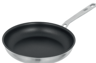
CULINARY FIVEPLY BRATPFANNE BESCHICHTET

Perfekte Wärmeverteilung ohne Angebranntes. Das Must-Have in Ihrer Küche.