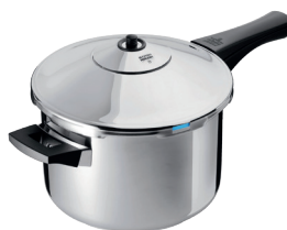
DUROMATIC® INOX STIELMODELL

z. B. Schoppen, Schnuller oder Einmachgläser schnell und unkompliziert sterilisieren.