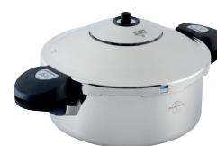
DUROMATIC® INOX FORMA SEITENGRIFFMODELL

Ø 20 cm / 3.5 L UVP € 219.00 € 169.00 3050 Ø 22 cm / 5.0 L UVP € 239.00 € 179.00 3342