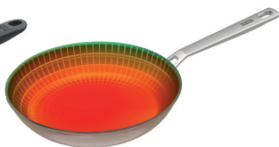
CULINARY FIVEPLY BRATPFANNE