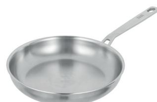
CULINARY FIVEPLY BRATPFANNE UNBESCHICHTET

Ø 20 cm UVP € 69.90 38503 Ø 24 cm UVP € 79.90 38504 Ø 28 cm UVP € 89.90 38505