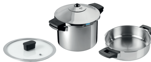
DUROMATIC® INOX SET 4-TEILIG

Ø 22 cm / 4.0 L UVP € 239.00 € 179.00 3042 Ø 24 cm / 6.0 L UVP € 269.00 € 199.00 3017 Ø 24 cm / 8.0 L UVP € 289.00 € 219.00 3018