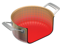
CULINARY FIVEPLY KOCHTOPF